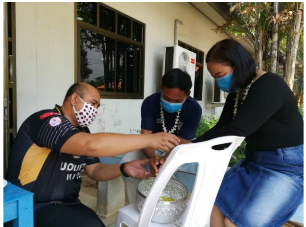
กิจกรรมวันสงกรานต์