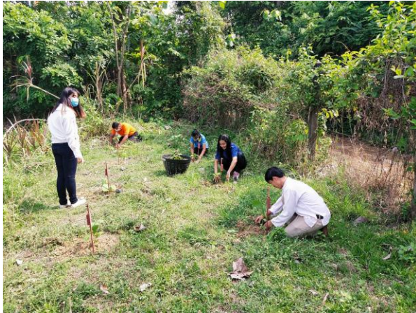
การสร้างสภาพแวดล้อมและบรรยากาศการทำงานที่ดี