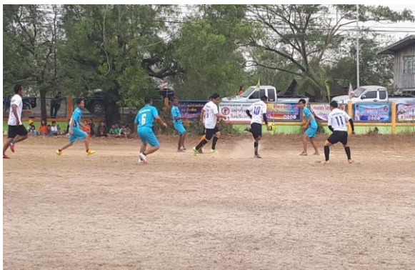
กิจกรรมงานกีฬาสัมพันธ์