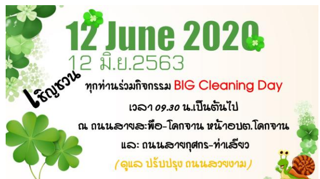
กิจกรรม Big Cleaning Day